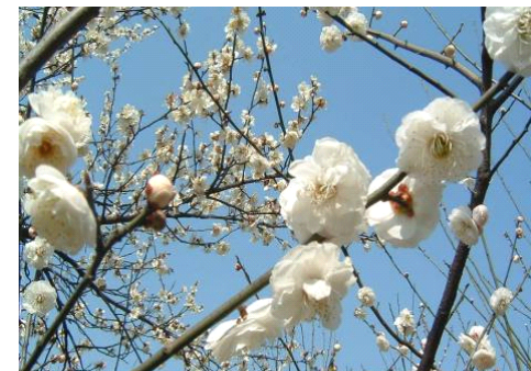
空山远, 白云休赠, 只赠梅花