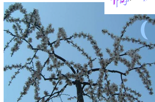
人散后, 一钩淡月天如水